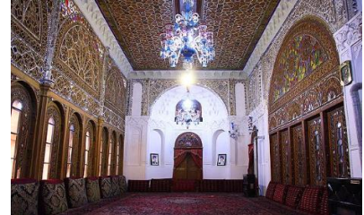
خانه امینی ها