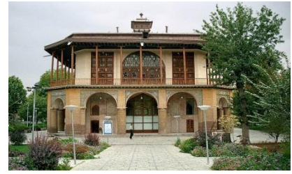
موزه خوشنویسی چهلستون