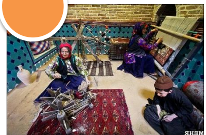
موزه مردم شناسی حمام قجر

تاریخ برگزاری: ۹، ۷، ۹ ام شهریور ۹۶ (صبح از ساعت ۸:۳۰، بعدظهر از ساعت ۱۷)